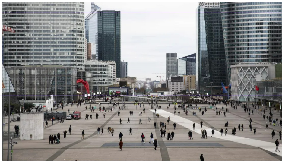
Des cadres se croisent sur le parvis de la Défense à Paris.

Les résultats ont étonné l'UGICT-CGT qui a commandé ce sondage à Viavoice avec le cabinet Secafi, que franceinfo dévoile lundi 26 septembre : 56% des cadres veulent une réforme des retraites qui leur permette de partir à 60 ans, avec une prise en compte des années d'études. Ce souhait est particulièrement marqué chez les seniors .